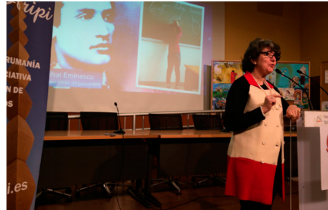
Evenimentul de marcare a Zilei Culturii Naționale (M. Eminescu), Univ. din Alicante / AMBASADA ROMÂNIEI ÎN REGATUL SPANIEI