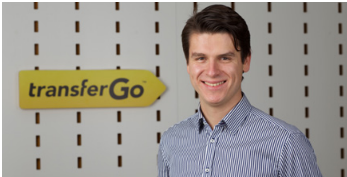
Daumantas Dvilinskas, CEO & Co-fondator TransferGo / WWW.TRANSFERGO.RO

Totul e online și simplu de urmărit. Fără să mergi la ghișee, fără să stai la cozi, fără completarea unui vraf de hârtii și fără să cauți cel mai avantajos curs valutar. Poți face totul online, de pe mobil, tabletă sau calculator. Banii sunt virati online, iar transferul se face la o rată mult mai bună decât cea practică de