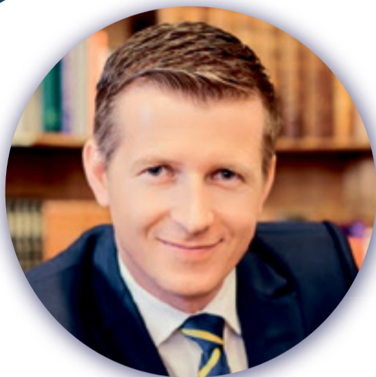
LORAND SOARES SZASZ STRATEGII EFICIENTE PENTRU CREȘTEREA FIRMEI TALE