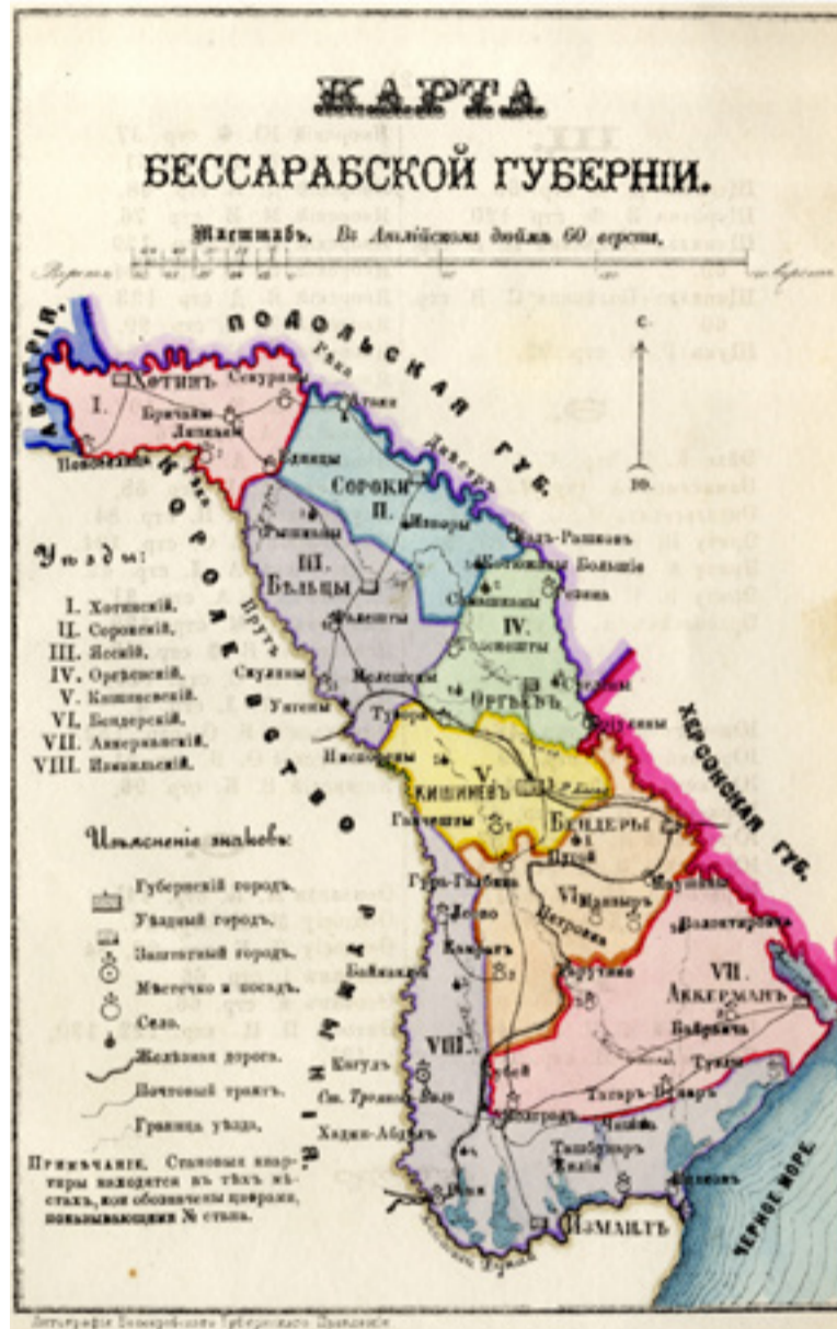
Mapa de 1883 de la gobernación de Besarabia y sus regiones en el Imperio ruso

la anexión de Besarabia a Rumanía. Así, en diciembre de 1917, La época recogía una noticia publicada por el diario inglés The Daily Chronicle en la que se anunciaba que “el comité central de Besarabia ha pedido al gobierno de Finlandia una copia del