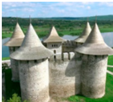
Castillo de Soroca—República de Moldavia (ciudad de Soroca) / MOLDOVA.MD

Paralelamente al debate suscitado en la prensa española en torno a la cuestión de si Rumanía debía aceptar o no la Besarabia aprovechando el derrumbe del Imperio zarista, se sucederá la publicación de informaciones relativas al proceso que culminará con