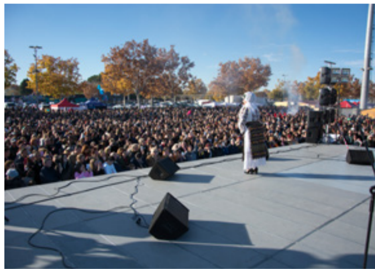
Românii au participat la festivalul dedicat Zilei Naționale a României

Mulțumește, de asemenea, partenerilor media: Agenția Națională de Presă AGERPRES www.agerpres.ro , Radio Românul www.radioromanul.es (107,7 FM Spania) și Ziarul El Rumano en España www.periodicoelrumano.es .