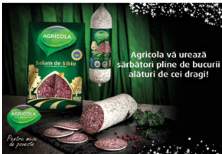
Agricola vă urează sărbători fericite!

Însă ingredientele de neînlocuit sunt și oamenii, specialiștii de la SALBAC, care știu să obțină la fiecare 70 de zile