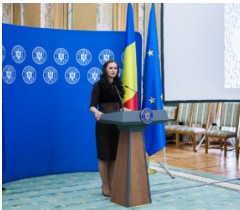
Ministrul pentru Românii de Pretutindeni, Natalia Intotero

binele cetățenilor români de oriunde reprezintă, în mod firesc, o preocupare a Guvernului”. „Indiferent că sunt elevi, studenți sau deja adulți angajați sau în căutarea unui loc de muncă, românii au libertatea de a se deplasa oriunde în lume, în funcție de preferințe, nevoi, oportunități, abilități sau calificare. Migrația pentru studii sau pentru muncă a generat o serie de nevoi noi, la care statul