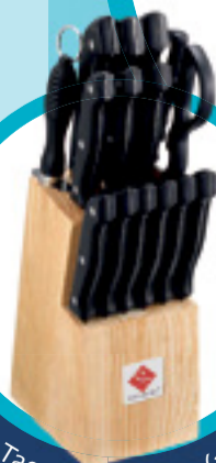
Tacoma Renberg (15 cuchillos)

si la suma de uno o varios seguros contratados es superior a 500€